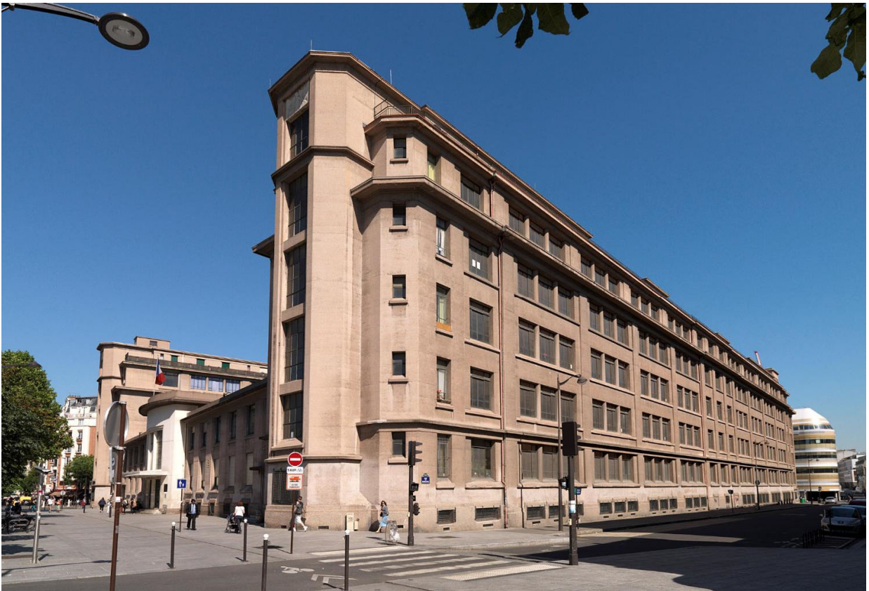
Façades à ravaler (avant mise sous filets de protection)