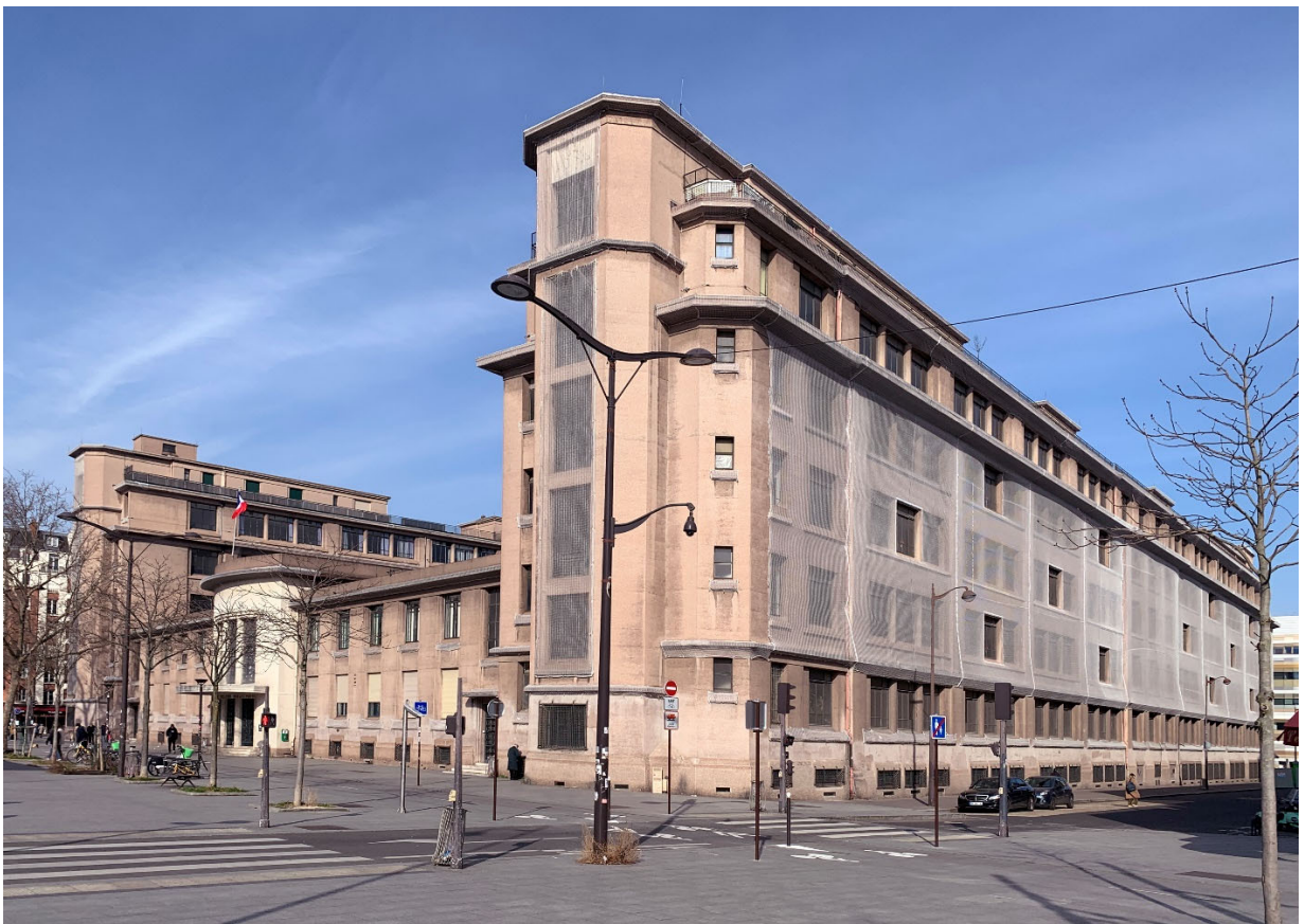
Façades sous filets de protection pour parer aux chutes de matériaux consécutifs au manque d'entretien