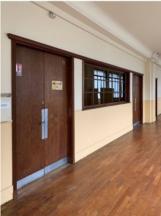
Portes et boiseries d'origine