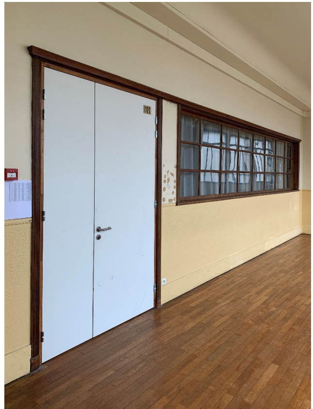
Porte remplacée dans la campagne de travaux en cours