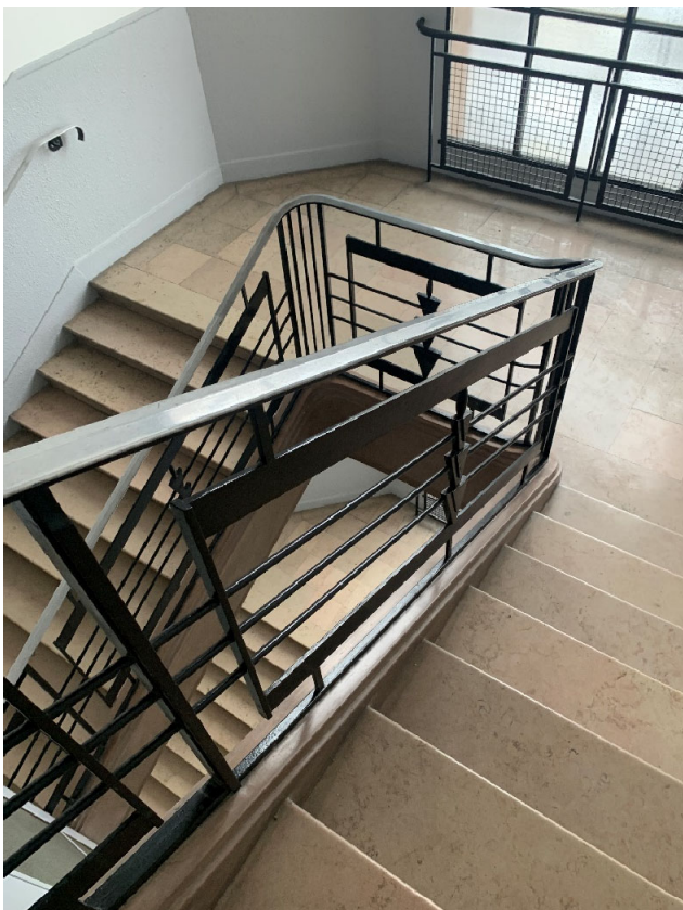
Cage d'escalier d'origine